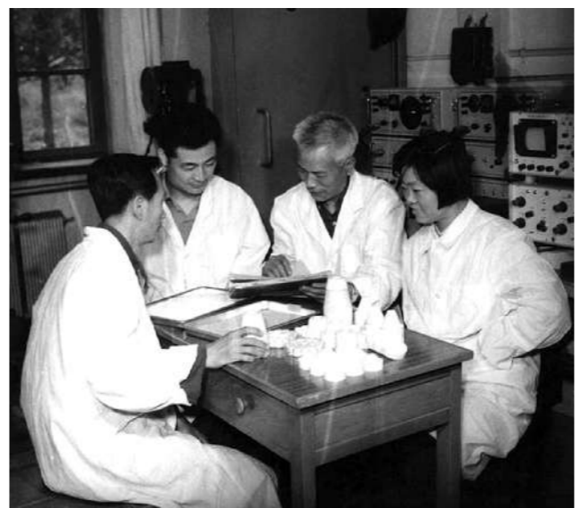
上世纪70年代,徐更光等教师成功研制8701高能混合炸药

2015年1月7日,一位老人的逝去牵动了北理工全校师生的心,他就是我国爆炸科学与技术领域的开拓者徐更光院士。1956年毕业留校后,他逐渐成长为一名混合炸药领域的顶级专家,身后为我们留下了“8701”、“海萨尔”等一个个高能炸药领域的革命性成果。上世纪七十年代,为了解决炸药腐蚀问题,徐更光带领团队不仅解决了炸药的热安定性问题,还创造性引入稳定体系,实现了对弹药中析出酸碱的自动吸收,从而保证了炸药的长期稳定性,解决了一个世界级难题,轰动业界,由此缔造出中国高能炸药的常青树——8701高能炸药,这一具有国际先进水平的成果,不仅获得全国科学大会奖,还被装备在我国多种型号的武器上。步入花甲之年,徐更光又为中国国防捧出了“海萨尔PW30甲高威力炸药”,这种领先世界的新型炸药,成为中国的“独门秘籍”,海萨尔炸药凭借在爆炸性能、安全性、起爆性能等方面优异的表现,为北京理工大学赢得“国家科技进步一等奖”,成为了中国炸药的一代巅峰之作。