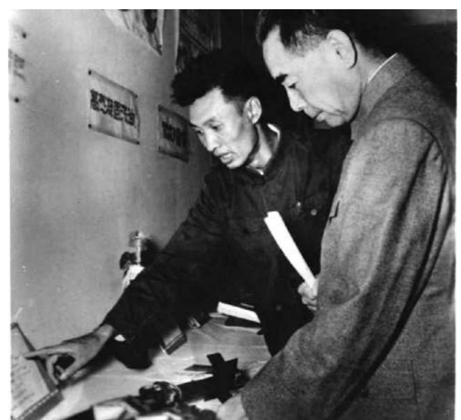
周恩来总理在1958年八一献礼展览会上详细了解北理工火箭复合推进剂的研制情况

2015年1月7日,一位老人的逝去牵动了北理工全校师生的心,他就是我国爆炸科学与技术领域的开拓者徐更光院士。1956年毕业留校后,他逐渐成长为一名混合炸药领域的顶级专家,身后为我们留下了“8701”、“海萨尔”等一个个高能炸药领域的革命性成果。上世纪七十年代,为了解决炸药腐蚀问题,徐更光带领团队不仅解决了炸药的热安定性问题,还创造性引入稳定体系,实现了对弹药中析出酸碱的自动吸收,从而保证了炸药的长期稳定性,解决了一个世界级难题,轰动业界,由此缔造出中国高能炸药的常青树——8701高能炸药,这一具有国际先进水平的成果,不仅获得全国科学大会奖,还被装备在我国多种型号的武器上。步入花甲之年,徐更光又为中国国防捧出了“海萨尔PW30甲高威力炸药”,这种领先世界的新型炸药,成为中国的“独门秘籍”,海萨尔炸药凭借在爆炸性能、安全性、起爆性能等方面优异的表现,为北京理工大学赢得“国家科技进步一等奖”,成为了中国炸药的一代巅峰之作。