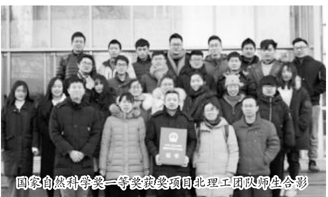
国家自然科学奖一等奖获奖团队合影

2018 年 1 月 8 日，在人民大会堂举行的 2017 年度国家科学技术奖励大会上，“聚集诱导发光 (AIE)”项目荣获国家自然科学奖一等奖，这个分量十足的奖项，由香港科技大学、浙江大学和北京理工大学合作完成。“聚集诱导发光 (AIE)”概念由中国科学院院士、香港科技大学讲座教授唐本忠在国际上首次提出，这一开创性的创新成果，为国际材料科学研究打开了全新的领域。作为该项目的第三获奖人，来自北京理工大学材料学院的董宇平教授，凭借自己的勤勉与创新，为这一中国人的原创性科技成就作出了一份北理工人的贡献。1994 年参加工作至今，董宇平在北理工的科研生涯已有 24 年，作为有机功能材料课题组学术带头人，面对获奖，他谦虚而言：“我和课题组的同事们，在北理工，一起找到共同的科研志趣，一起培养优秀的学生，一起创新奋斗，‘在一起’的感觉上我们很幸福，获奖的荣誉属于我们每个人。”