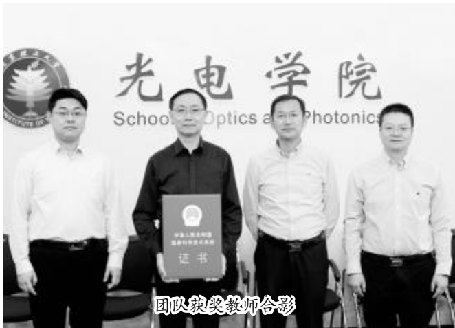
团队获奖教师合影

“北理工的光学工程，在国内建立比较早，多年来的发展积累了扎实的基础，所以我选择了从这里延续我的科学梦想。1988 年，留学英国的王涌天，在北理工光学工程学科的诚挚邀请下欣然回国，成为国内首批“海归”人才。此后，他长期致力于技术光学和虚拟现实领域的教学科研工作，并带出了一支朝气蓬勃、成果频出的科研队伍。日前，在人民大会堂举行的国家科学技术奖励大会上，王涌天团队喜获 2017 年度国家技术发明奖二等奖。这支登上中国科技界最高盛会领奖台的科研团队再次引发师生关注。