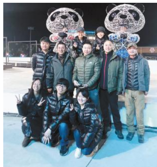
其中通过数据研判,自动展示表现最佳演员的“每日之星”功能,更是深受好评,对整个表演团队形成有效鼓励,营造了积极向上的排练氛围。(文/党委宣传部 韩姝杉)

技术和数字表演与仿真技术,专门创新研发了文艺表演预览系统和训练软件,对表演方案进行全方位仿真,较好地保证了前期创意设计到现场排练工作的顺利进行,得到了导演组和参演团队的一致好评。 其中,文艺表演预览系统以可视化的界面和图纸、视频等多种数据输出载体将各种待选表演方案的真实效果进行呈现,帮助导演把控、决策及完善表演方案,从而确定最终方案;训练软件与数字验证系统可将创意数据转化为执行数据,指导表演要素进行排练,并保证数据在空间、时间上的一致性与准确性,同时将执行中修改的执行数据在表演要素中同步,帮助导演实时观察到演员和道具的队形状态以及演员的姿态,以便指导后续节目的编排,演员也能迅速直观地了解自身与理想运动轨迹之间的偏差并及时纠正,实时、快速地熟悉表演方案。 此外,我校团队还以北京理工大学自主研发的双目增强现实智能眼镜为基础,对核心表演道具“大熊猫”进行了“视觉改造”,为大熊猫道具的外挂摄像头加装云台,并与内部演员的智能眼镜相结合,从而解决了身处道具之中的演员在表演过程中,因内外光线差异导致对周围环境观察受限的问题,使演员在大熊猫道具内部能无差别观察到外部环境。同时,我校团队还承担了整个表演数秒倒计时任务,衔接各技术团队,确保在排练过程中各项设备的时间统一。另外,我校团队还开发了赴平昌倒计时专用小工具,