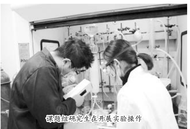
课题组研究生在开展实验操作