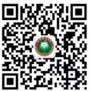
请扫描二维码,关注“北京理工大学官方微信订阅号”

2月25日,新学期伊始,“北京理工大学官方微信订阅号”正式上线,该微信公众号正式上线,标志着我校官微矩阵的全面升级。 本次全新推出的“北京理工大学官方微信订阅号”作为发布北理工权威资讯、全方位展示北理工风采、积极传播北理工优秀文化、推动校园媒体融合的校级新媒体核心平台,将与我校已有的“i北理”“i北理小研”“i北理企业号”一起,形成全新的校级新媒体矩阵,充分发挥各平台特点,差异化建设,实现对校内受众的精准覆盖,有效提升校园新媒体宣传成效,服务学校“双一流”建设。 值得一提的是,25日,作为“北京理工大学官方微信订阅号”发出的第一条推送《揭秘!平昌冬奥会闭幕,酷炫“北京8分钟”背后,这个北理工团队用科技点亮精彩!》,获得了“10万+”的阅读量。 欢迎各位师生、校友以及社会各界人士给予积极关注。(党委宣传部 马瑶)