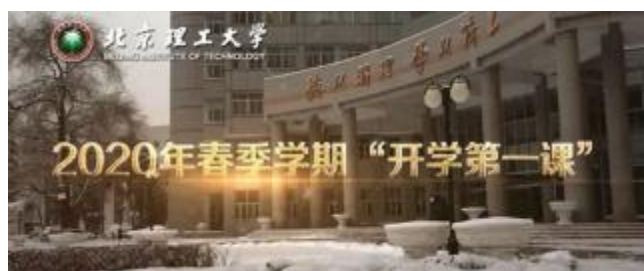
▲在春季学期“开学第一课”上,校党委书记赵长禄以“共克时艰担使命,勠力同心战疫情”为题,校长张军以“明德精工,风雪同行”为题,通过网络平台为身在四面八方的北理工师生授课。