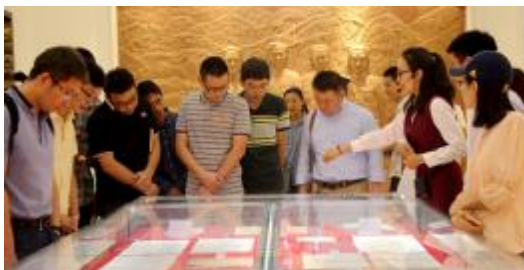
▼北理工时代新人宣讲团宣讲员代表共同诵读习近平总书记纪念五四运动100周年大会上的讲话片段