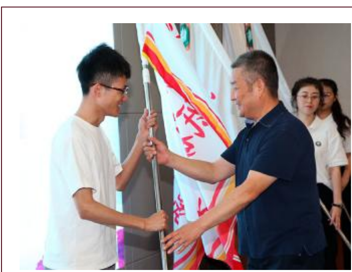
▲2019年6月选调生座谈会暨出征仪式上,校党委书记赵长禄为新疆、西藏等17个省份的选调生代表进行出征授旗。

“在北理工青年现象的背后是北理工精神、北理工信念”“党的事业就是我们的奋斗方向”“新时代要培养好胸怀壮志、明德精工、创新包容、时代担当的领军领导人